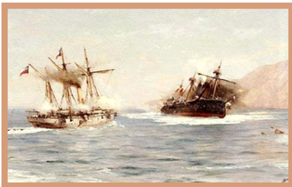
Combate Naval de Punta Gruesa, enfrentamiento entre la Goleta Artillada Covadonga y la Fragata Blindada Independencia , decidido a favor de Chile, por la pericia de Condell, al lograr que la Independencia encallara en los roquerios

Como se desprende, en este listado de socios de ambas cooperativas, están presentes numerosos guerreros que participaron en la Guerra del Pacifico.