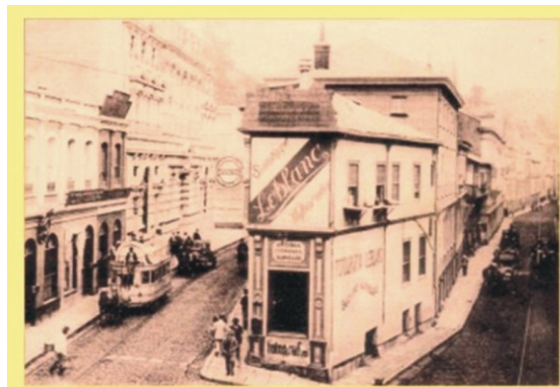
Bifurcacion llamada Cruz de Reyes en 1890, donde hoy se encuentra el Edificio del Reloj Turri.

En Valparaíso República de Chile a veintiuno de mayo de mil ochocientos ochenta i siete ante mi Joaquín 2º Iglesias, notario y conservador de bienes raíces de este departamento i testigos, cuyos nombres se expresaran a la conclusión, comparecieron los señores: