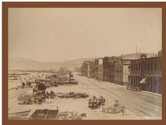
Vista del Malecon (Costanera), en Valparaiso 1888