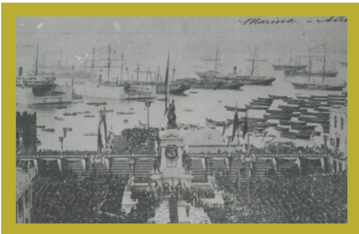
Inauguración del Monumento de la marina, dedicado a los Heroes de Iquique ubicado en la Plaza Sotomayor en Valparaiso foto del acto de fecha 21 de mayo de 1886

Los socios fundadores suscriben la totalidad de las acciones en que se divide el capital social, i en el mismo instrumento se expresan el nombre, apellido, profesión i domicilio de cada uno de ellos.