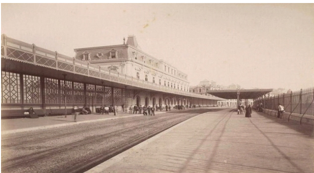
La hermosa Estación de Trenes Bellavista Año 1888