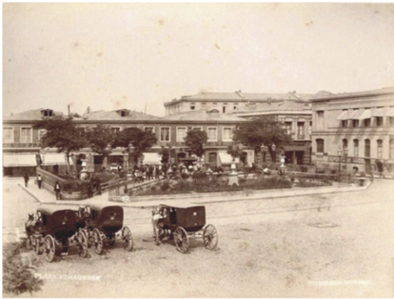
Plaza Echaurren 1888

mensualidades de cinco pesos, el ochenta por ciento restante, ningún accionista podrá poseer mas de treinta acciones.