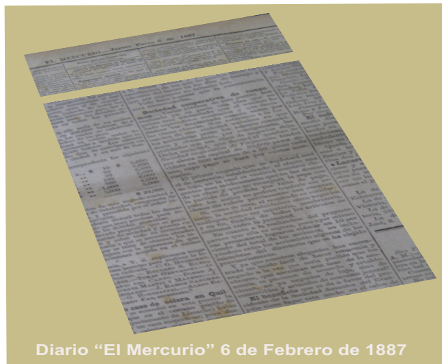
Diario "El Mercurio" 6 de Febrero de 1887

Transcurrían los primeros días del mes de enero de 1887, en la Zona Central de Chile, había una actividad febril, debido a una epidemia de colera desatada en Paraguay y la parte Norte de Argentina, ya que se pensaba que la vía de ingreso de la epidemia sería por la ciudad de Los Andes (como ocurrió), se emitían Decretos Sanitarios tendentes a enfrentar la emergencia, incluso se instaba a las señoras de bien a constituir una sociedad de socorros mutuos para atender a los niños huérfanos del colera.