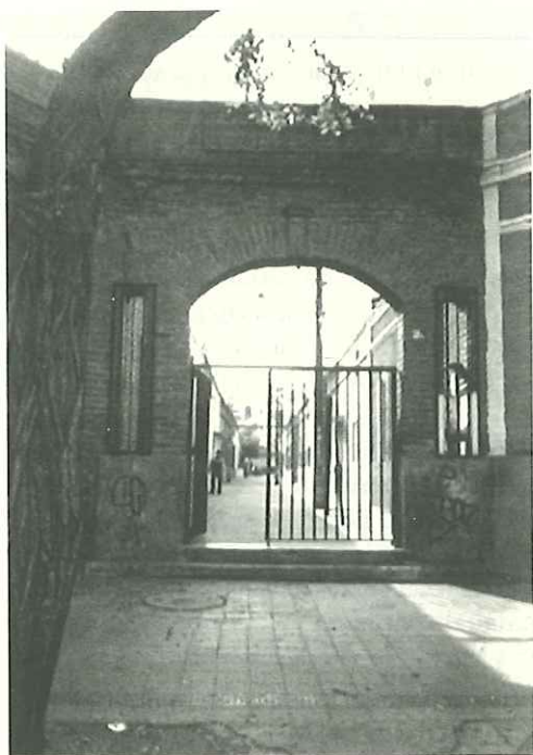
Figura N° 4: Vistas actuales del cité Pozo, construido a principios del siglo XX en Santiago de Chile.

se trata de un conjunto de 156 viviendas construidas en un área de dos hectáreas, siendo las habitaciones de menor tamaño de 32 m 2 (figura N° 5).