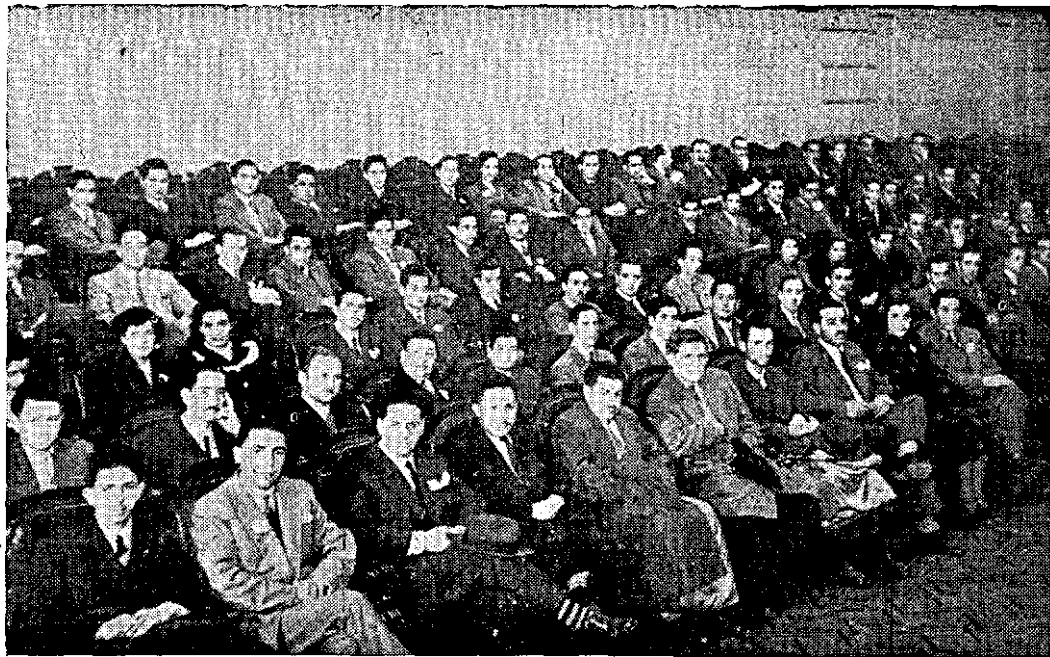
Aspecto parcial del Salón de Honor