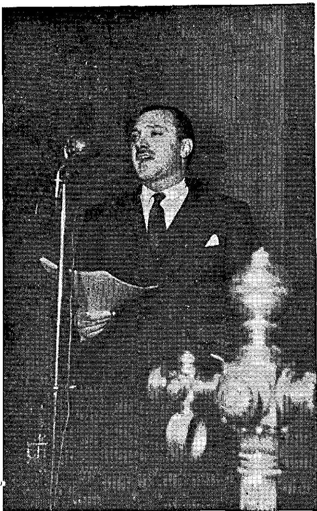
Don Enrique Campos Menéndez, pronuncia su discurso en representación de los diputados.