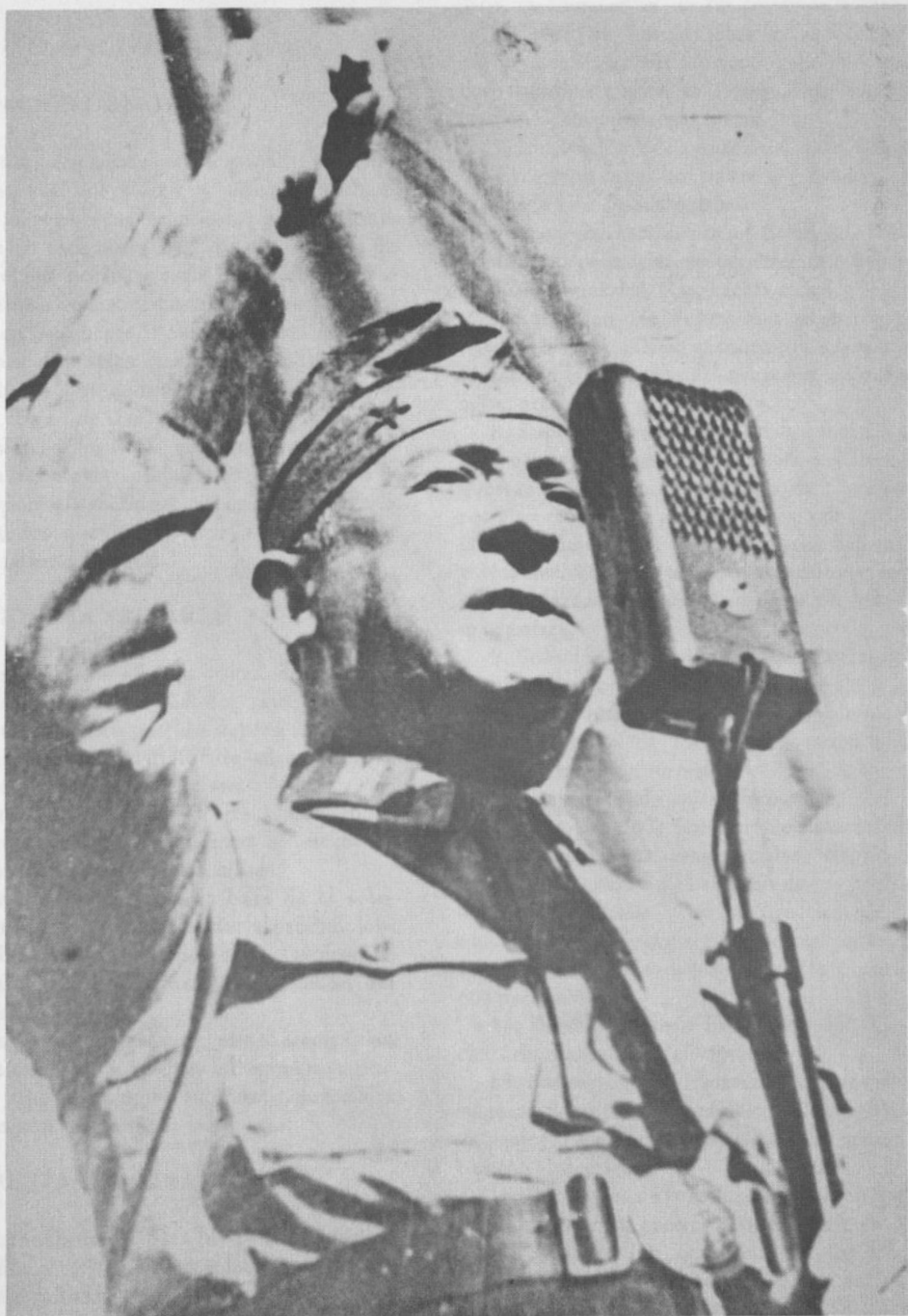
Marmaduke Grove Vallejos