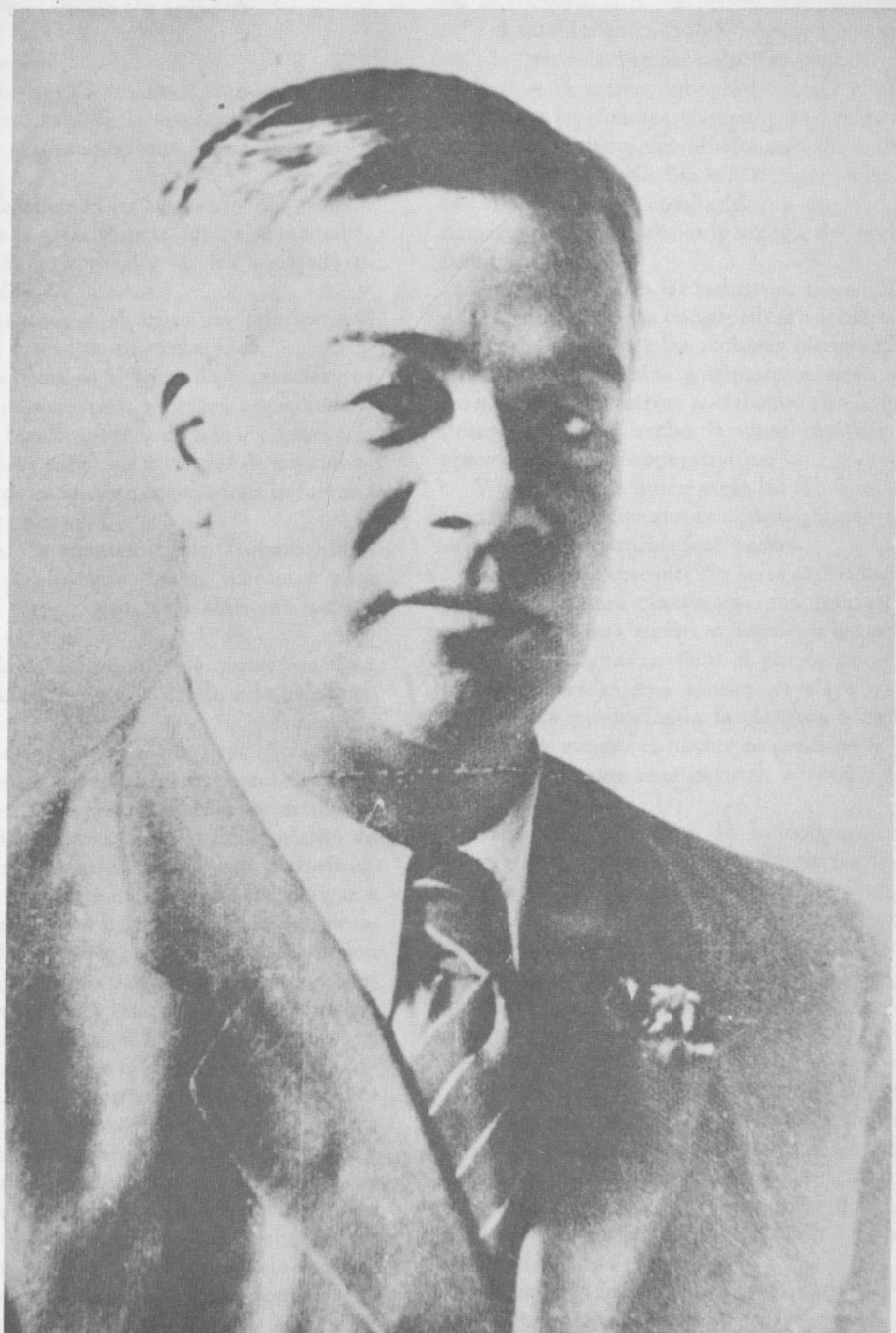
Luis Emilio Recabarren