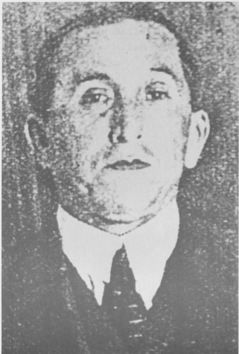
Manuel Hidalgo Plaza