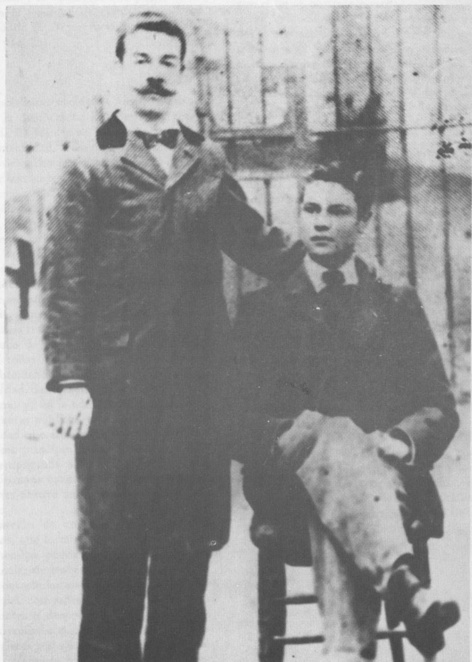
Luis Emilio Recabarren y Alejandro Escobar Carvallo