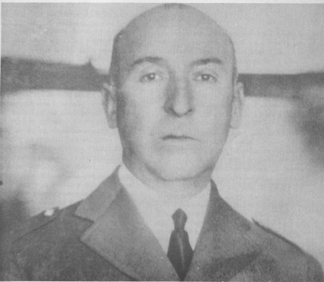
Marmaduke Grove Vallejos